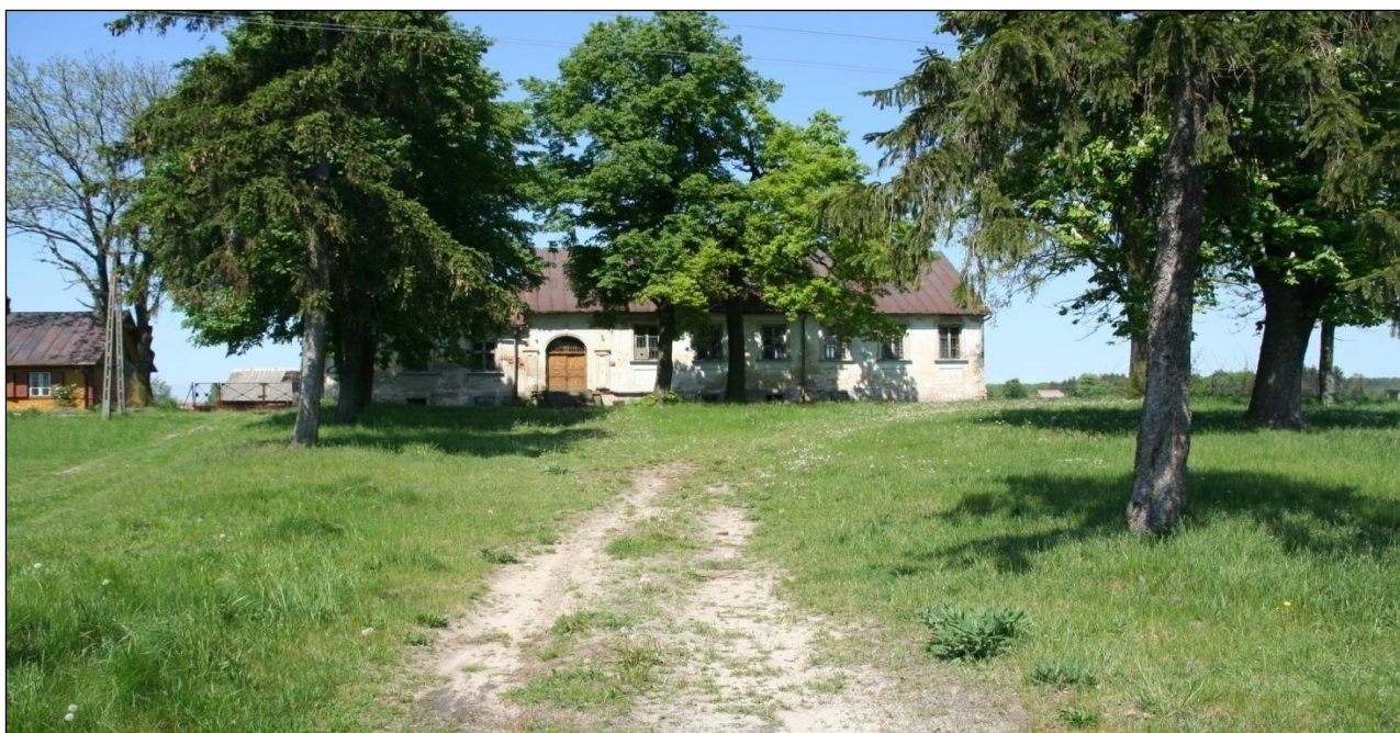
Dawny zbór ewangelicki z 1875 r. w Cycowie

Obszar gminy Cyców dodatkowo zasługuje na uwagę ze względu na zwycięską bitwę polsko-bolszewicką 1920 r., osadnictwo niemieckie oraz charakterystyczne dla rzeźby zagłębienia krasowe. Historia bitwy pod Cycowem (1920) jest szczególnie pieczołowicie kultywowana na terenie gminy. W miejscowym Zespole Szkół utworzono w 2005 roku Izbę Tradycji 7 Pułku Ułanów Lubelskich. Między innymi zamieszczono tam schematyczną mapę bitwy (rys. 3).