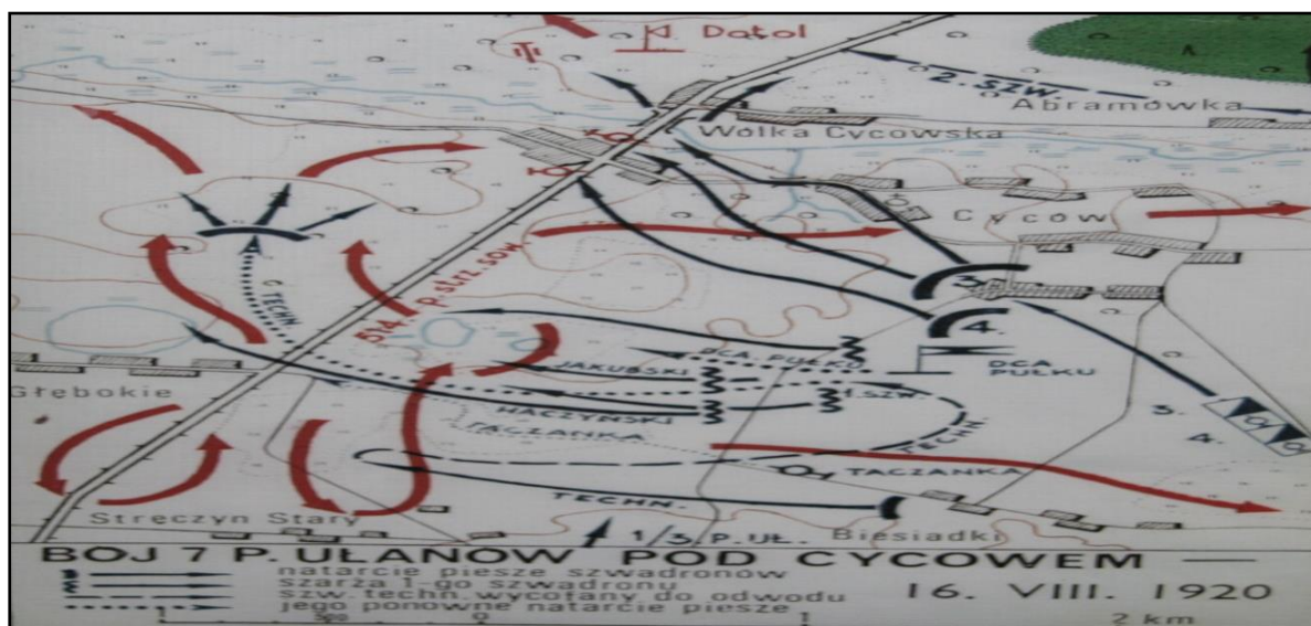
Rys. 3. Mapa bitwy pod Cycowem z 16 VIII 1920 roku

Obszar gminy Cyców dodatkowo zasługuje na uwagę ze względu na zwycięską bitwę polsko-bolszewicką 1920 r., osadnictwo niemieckie oraz charakterystyczne dla rzeźby zagłębienia krasowe. Historia bitwy pod Cycowem (1920) jest szczególnie pieczołowicie kultywowana na terenie gminy. W miejscowym Zespole Szkół utworzono w 2005 roku Izbę Tradycji 7 Pułku Ułanów Lubelskich. Między innymi zamieszczono tam schematyczną mapę bitwy (rys. 3).