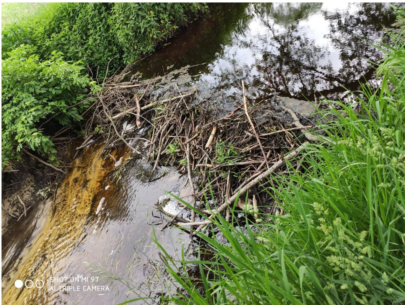
Tama Bobrów na rzece Śwince w Ludwinowie

Walory te zostały dostrzeżone m.in. poprzez utworzenie Poleskiego Rezerwatu Biosfery. Jednak obszar ten obejmuje jedynie niewielki fragment gminy Cyców. Nie należy zapominać o walorach krajobrazowych pozostałej części gminy, pozornie niewielkich, jednak skrywających bogactwo przyrody i kultury. Konieczne jest wyeksponowanie tych walorów poprzez odpowiednie zagospodarowanie turystyczne.